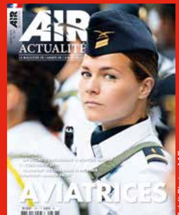
Page de couverture AIR ACTUALITES

En ce mois de mars, votre magazine Air actualités rend hommage aux Aviatrices, d'hier et d'aujourd'hui. Retrouvez un dossier sur ces pionnières qui ont ouvert la voie aux femmes dans l'armée de l'Air et de l'Espace. Après un historique retraçant le parcours exceptionnel de figures emblématiques telles qu'Hélène Boucher, Joséphine Baker ou encore Maryse Bastié, partez à la rencontre de celles qui sont engagées aujourd'hui dans différentes spécialités. Un peu plus loin, découvrez le parcours hors du commun du capitaine Valérie André qui a inspiré des générations d'Aviatrices et d'Aviateur