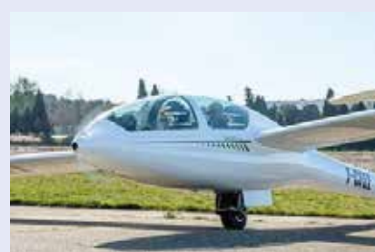
Le planeur DG-1001 eNEO F-CFEE