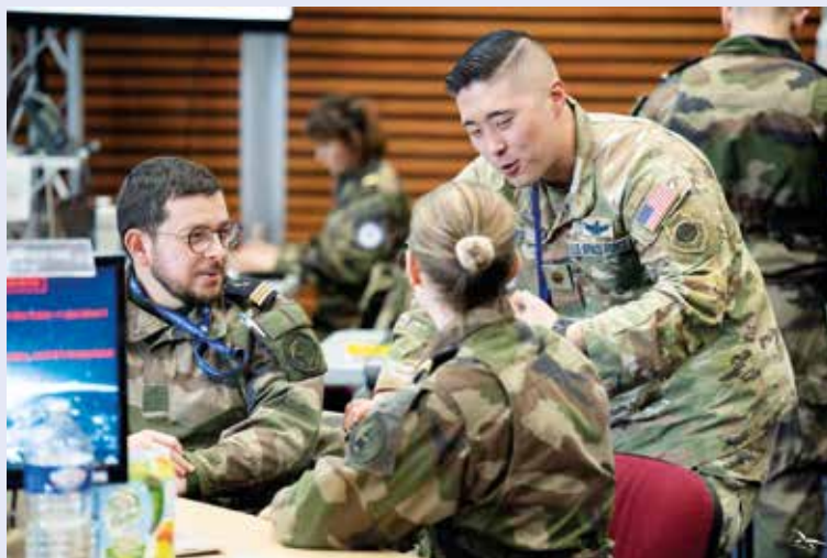
Des aviateurs du CDE avec un partenaire américain

Il entraîne l'ensemble des unités du CDE dans un environnement spatial simulé complexe, crédible, international et multi-domaines. Comme le spécifie l'armée de l'Air et de l'Espace dans le dossier de présentation d'AsterX, il a pour objectif de « poursuivre l'acculturation des armées au domaine spatial et, in fine, développer l'aptitude aux opérations spatiales militaires du personnel du CDE en environnement international et multi domaines ».