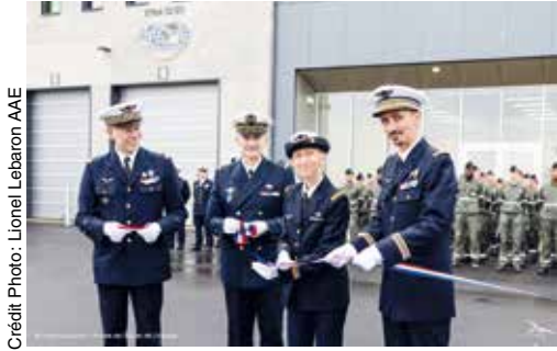
Inauguration de la nouvelle Escale

besoins énoncés et programmés se mettent en place sur plusieurs années au fur et à mesure. C'est très excitant, c'est une base qui vit, qui réagit, qui se met à niveau ».