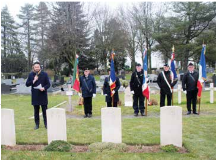
Les porte-drapeaux devant la stèle