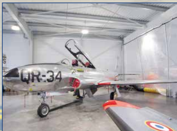
Top Gun voltige - Lockheed T-33 Silver Star

Trimestriel : Janvier - Février - Mars 2024 - Prix : 5,50 € - N° 177