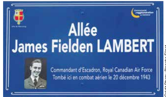
Plaque érigée en hommage au pilote