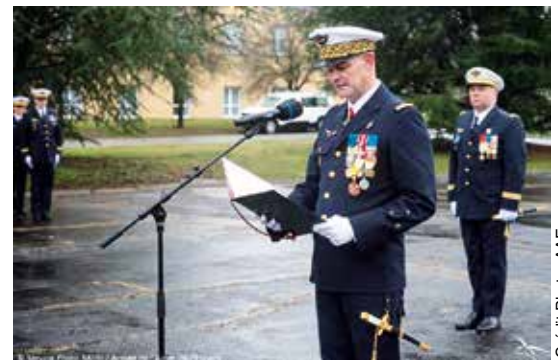
Lecture de l'ordre du jour du 20 ème anniversaire, par le général de division, chef du CDE