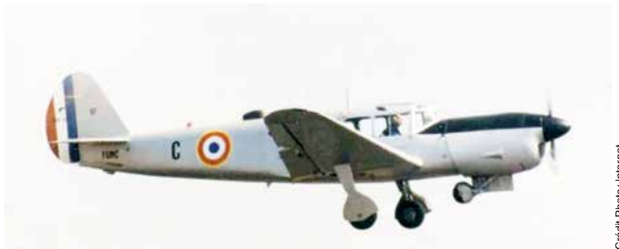
Nord 1100 Ramier

Dans le doute, nous fîmes tous deux demi-tours et allâmes inspecter notre « Ramier »... Après examen, nous constatâmes, stupéfaits, que ces vindicatifs « passeurs » nous avaient réellement tiré dessus ! L'aile droite de l'avion avait été touchée et au-dessous de celle-ci, nous découvrîmes des « petits trous » !.