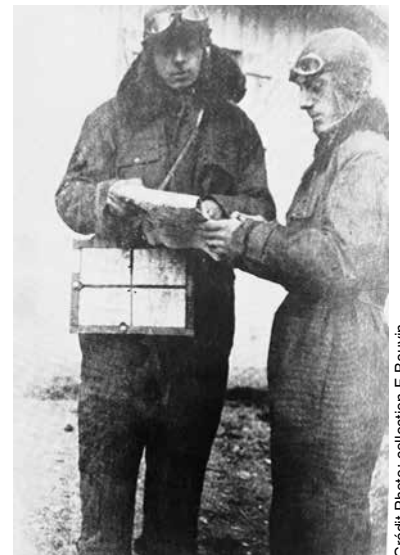
St-Exupéry et son ami Pintenet préparant une mission d'observation à l'école d'Avord en 1922