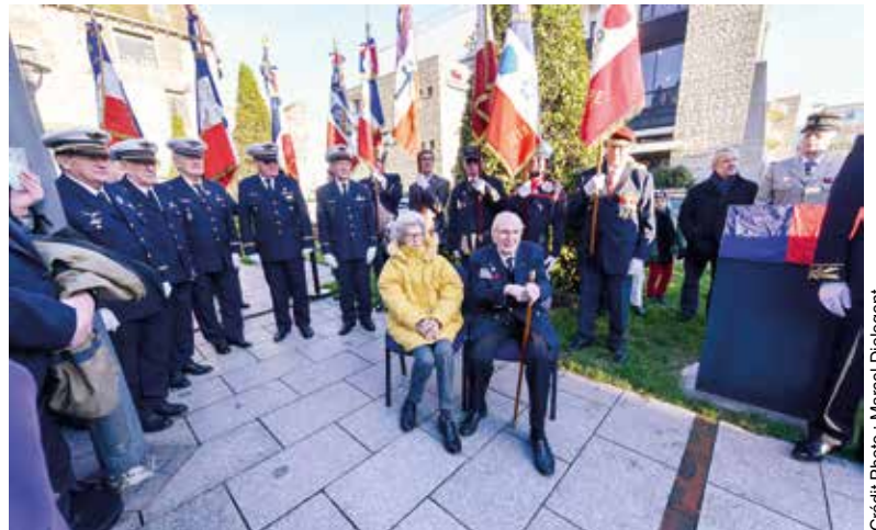
Jean-Caillet : la cérémonie

L'Amicale des FAFL garante du devoir de mémoire, organise chaque année fin mai son Assemblée générale à Grandcamp-Maisy. Ce petit port normand où est érigé le magnifique monument à la Gloire des Groupes Lourds Français : le 2/23 Guyenne et le 1/25 Tunisie. Créé en 1944, sur la base anglaise d'Elvington, et dotés de quadrimoteurs Halifax, onze équipages participent aux côtés des alliés au Débarquement de Normandie. Leur mission est de neutraliser la batterie allemande de Maisy. C'est la raison pour laquelle ce monument est implanté à Grandcamp-Maisy, tout près du site de cette batterie côtière du mur de l'Atlantique non loin des plages du débarquement et que l'on peut encore visiter.