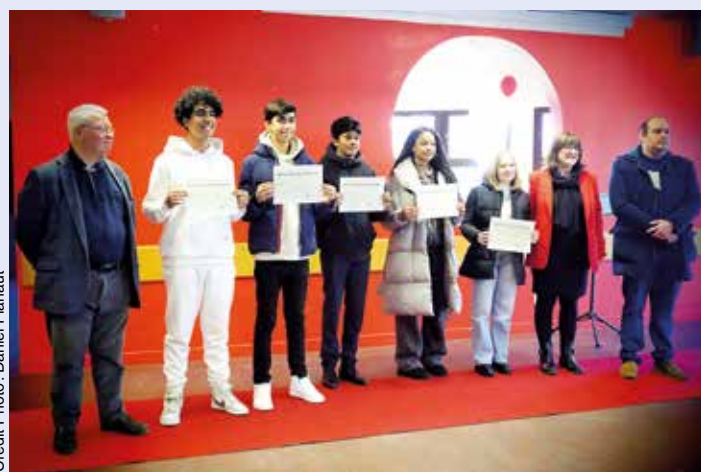
Lauréats BIA 2023 Lycée Baudelaire de Fosses