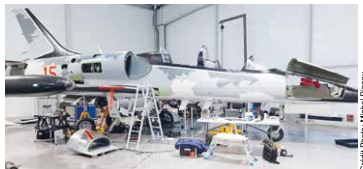
L-39 en atelier