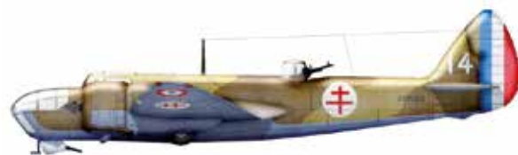
Bristol Blenheim IV des FAFL (Profil Cédric Chevalier)

En décembre 1940, le Tchad, premier grand territoire français à s'être rallié à la France libre – le 28 août précédent – a besoin d'une protection aérienne pour contrer la menace venant de Tripolitaine (colonie italienne en Libye) et du Niger (toujours vichyste). Aussi, le 24 décembre 1940, est créé le groupe réservé de bombardement n° 1 (GRB 1) – dénommé aussi : groupe de reconnaissance et de bombardement n° 1. L'unité est constituée par la fusion des formations « Topic » et « Jam ». Elle se compose de deux escadrilles dotées chacune de six Blenheim . La 1 ère escadrille étant placée sous les ordres du capitaine Gustave Lager, la seconde sous le commandement du capitaine Pierre Tassin de Saint-Péreuse. Le GRB 1 est considéré comme la première véritable unité FAFL.