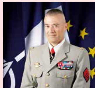
Le général d'armée Thierry Burkhard CEMA