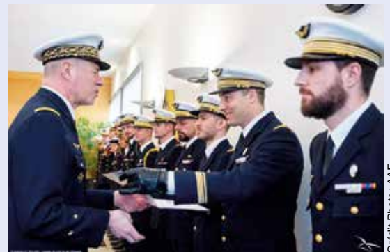
Remise du Patch QWI et du certificat de qualification