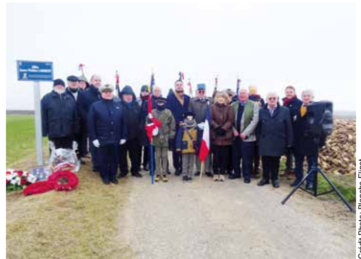
Les participants à la cérémonie sur l'allée