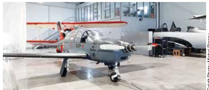
Socata TB-30 Epsilon