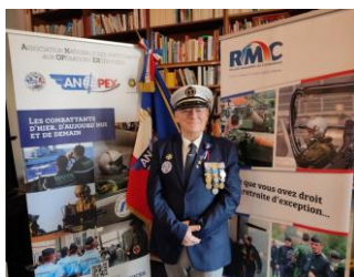
Un membre de l'ANOPEX mis à l'honneur dans le Bas-