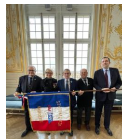
L'ANOPEX entre en force au comité