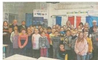
L'ANOPEX soutient une école du Maine et Loire pour un voyage pédagogique sur les plages du débarquement