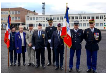
L'ANOPEX de la Corrèze a participé à la